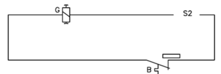
Ochranný obvod proti haseniu plameňa.

B- termostat; G- Integrovaný solenoidový ventil v ochrannom obvode proti zlyhaniu plameňa; M- motor ventilátora; Q - vypínač; Q2-zapaľovanie; S- zapaľovacia ihla, S2- termočlánok; Y-solenoidový ventil; C-kondenzátor